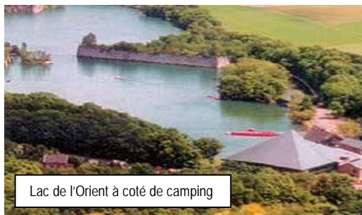
Lac de l'Orient à coté de camping