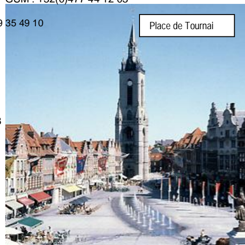
Place de Tournai